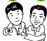
取材：平古力三