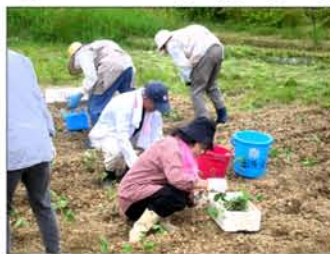
6月6日 班ごとに苗植え

か報道されていましたが、庶民の生活には実感できるような状況ではありません。さて、地区の方に目を向けますと、少子高齢化を一段と感じているところです。昨年は複数の町で式年造替宮が執り行われました。そこで一番感じましたのは、「生まれ育ったふる里がいつまでもあってほしい」「いつでも帰ってこるところがあってほしい」と参加者の多くの方がおっしゃっていたことです。このあって当たりまえの風景を、ずっと引き継がれてきた人の営みを、守り続けることが私たちの使命の一つではないかと感じている初春です。