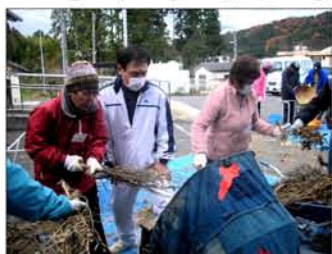
11月28日 脱穀・豆の選り分け