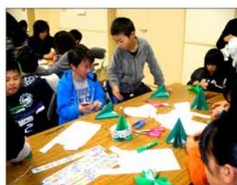
かわいいツリーが出来ました