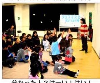
分かった人？はい！はい！「これなーに？」で盛り上がったよ