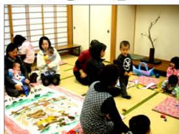
お友達がたくさん！みんな楽しそう

自主グループ「アンダンテ」と公民館のひと足早いクリスマス会が行われました。12月7日のクリスマス会では、50名の参加者が折り紙でクリスマスツリーを作ったり、クリスマスアニメの鑑賞、ゲーム、おやつバイキングを楽しみました。また、田原にホームステイ中のジュネーブの学生さんが、その様子を撮影するために来館しました。 保健師さんと管理栄養士さんによる健康相談が初めて田原公民館で開催(11月29日)当日5組の親子12名が参加され、赤ちゃんとお母さんの楽しい交流の場になりました。また今回の相談日は ●1月31日(金) 午前10時～午後3時迄 費用は無料、予約制 ●お申込み・お問合せ 都祁保健センター(電話) 0743・82・0341