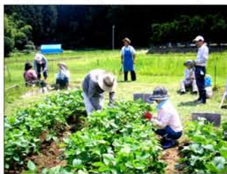
7月25日 芽摘み・うね上げ

特に印象に残った事は、足踏み式の脱穀と豆の取り分け作業でした。おしゃべりしながらせつせと山盛りの大豆と格闘したこ