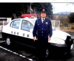
地域の安全を守ります