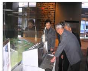
ボタン操作で電車を動かそう