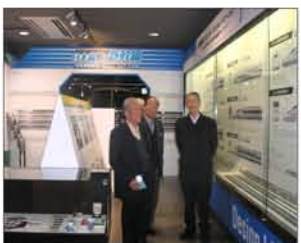
新幹線の歴史が良くわかるね