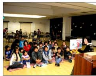
クリスマスのお話楽しいな