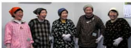
ぶるん会の皆さん

麴作りから始まる手作りのみそ作り、2回の講座です。一から作る「手作り麴みそ」は無添加、無着色で安心、安全です。しかも田原で育った材料で作るので、美味しさもひとしおです。我が家の味をもう一つ増やしませんか。講師は「手作りこんにやく」のぶるん会の皆さんです。