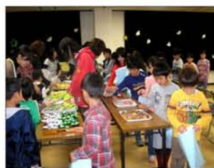
お楽しみのおやつバイキング