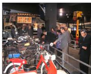
懐かしいバイクに興奮!