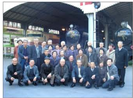
中央・矢田原・北部・南部単位会の皆さん

朝は冷たかったもののお天気に恵まれ、皆さん和気あいあい、楽しい帰路になりました。