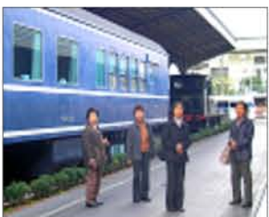
列車で旅に出掛けたいわ