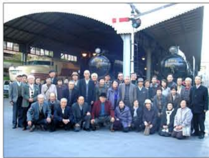
東部・下水間・上水間単位会の皆さん