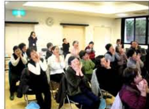
1月 津軽三味線の演奏とリズムで体操や踊りまで盛り沢山。