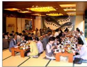
9月 楽しい落語に おいしい食事 大満足！