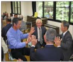
5月 開講式 歌唱指導