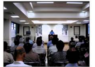
6月 防犯意識が高まりました。