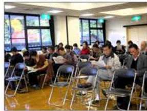
11月 お酒と上手につきあおう。