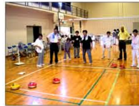
7月 スポーツを満喫！！