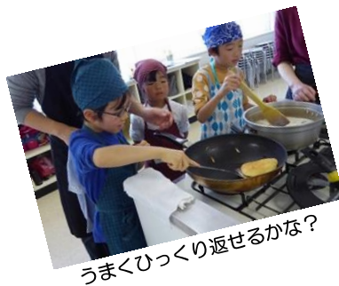
うま〜くひっくり返せるかな？

一緒に料理することで親子のふれあいを促すことを目的として開催している定番事業！今回は、オムレツケーキとサラダツリー、きのこいっぱいスープ作りに挑戦しました。