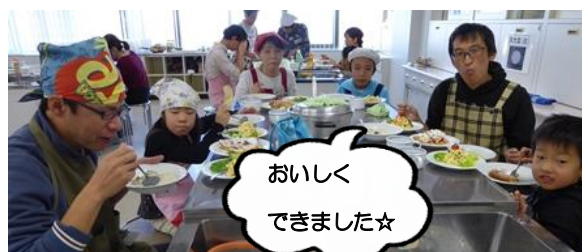
おいしく できました☆