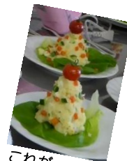
これがサラダツリー