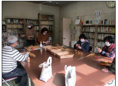
展示だけでなく、すすきのオーナメントづくりも開催しました！