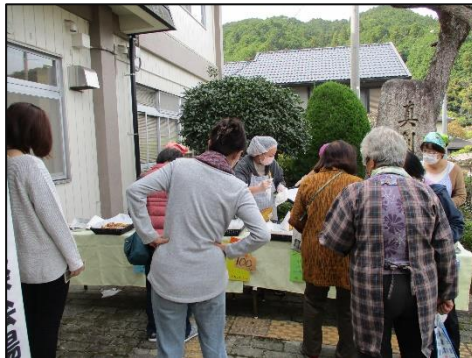
自主グループのみるくぼんさんによるパンの販売をおこないました！