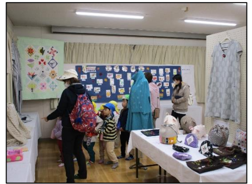
地域の方々や各種団体の作品も展示！どれも素晴らしい作品でした！