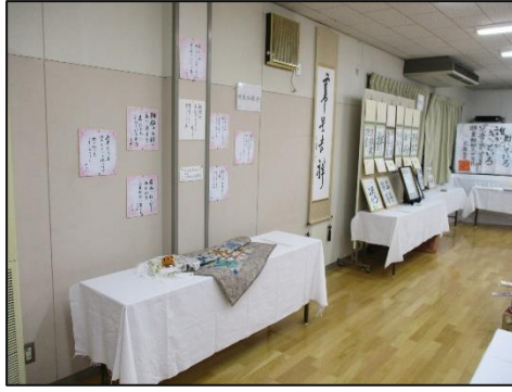
公民館で活動されている自主グループの日頃の学習成果をご覧ください！