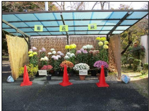
展示は館内だけではなく、館外でも！館外では菊花展や・・・