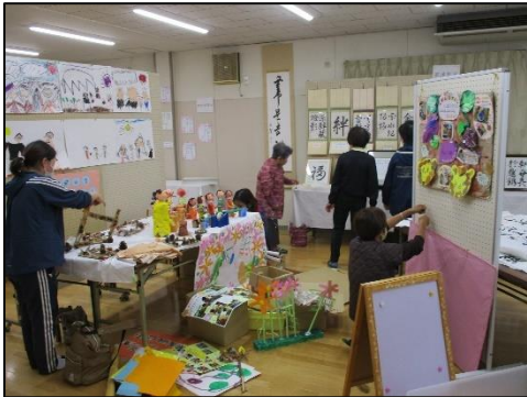
前日の準備の様子。外が暗くなるまで準備をされていました！

第35回 柳生地区文化祭を11月6日から12日までの6日間、開催いたしました。当館登録の自主グループや地域の皆様からの多数のご出展、ご協力により、昨年を大幅に上回る172人の方にご来場いただきました。出展していただいた皆様をはじめ、ご来場いただいた皆様。ありがとうございました。